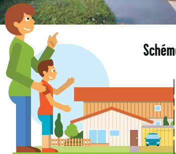
Schéma fonctionnel d'une maison mitoyenne

C'est un Village conçu dans le respect de l'environnement tant sur le plan des matériaux employés pour sa construction – principalement le bois – que sur celui de son fonctionnement quotidien visant une réduction significative de consommation d'énergie (niveau de performance minimum E2C2 (1) ). Sablons est le premier ÉcoVillage d'Enfants et d'Adolescents ACTION ENFANCE. Un ÉcoVillage a aussi une dimension pédagogique : un dispositif de tri avancé est prévu, en lien avec les services locaux, des potagers et des composteurs seront installés dans les espaces extérieurs, des tablettes permettront aux enfants, comme aux éducateurs, de suivre en temps réel la consommation de leur maison.