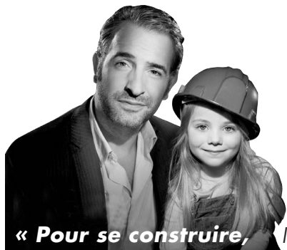
Jean Dujardin, parrain depuis 2009

Jean Dujardin et Marc Lièvremont savent ce que le mot « fratrie » signifie. Le premier a trois frères et le second sept frères et sœur. Ensemble, ils sont engagés activement à nos côtés.